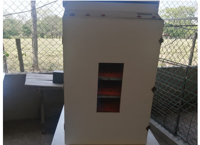
Figura 4. Incubadora de huevos.