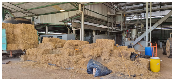
Figura 1. Pacas de pastizales elaboradas en el rancho “El Morelos”