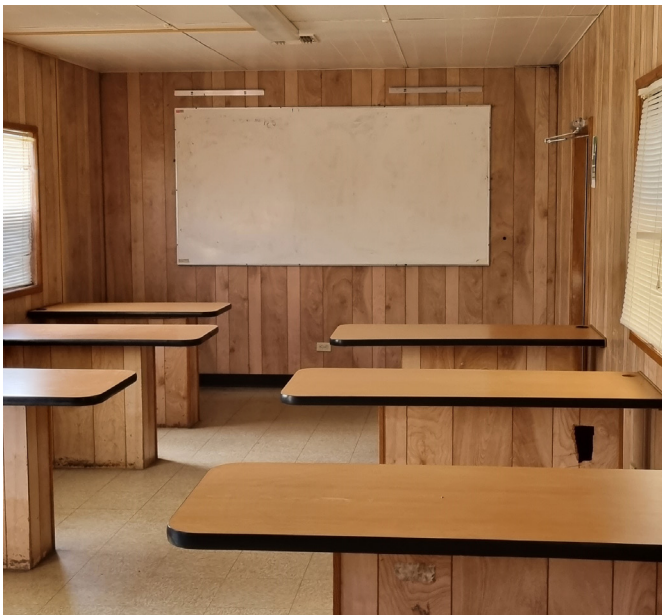
Figura 7. Campers