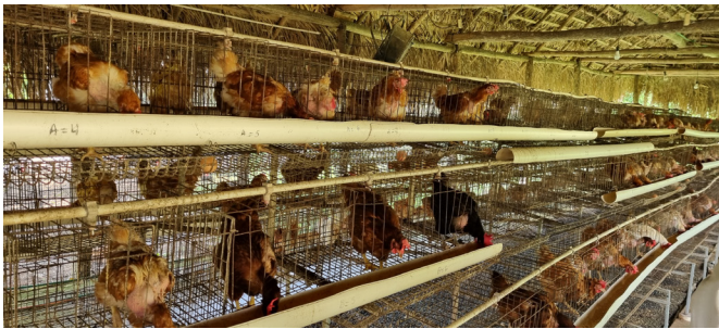
Figura 2. Módulo de gallinas ponedoras enjauladas y libres.