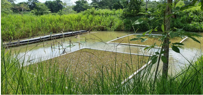
Figura 6. Vista de la producción de algas en el rancho.