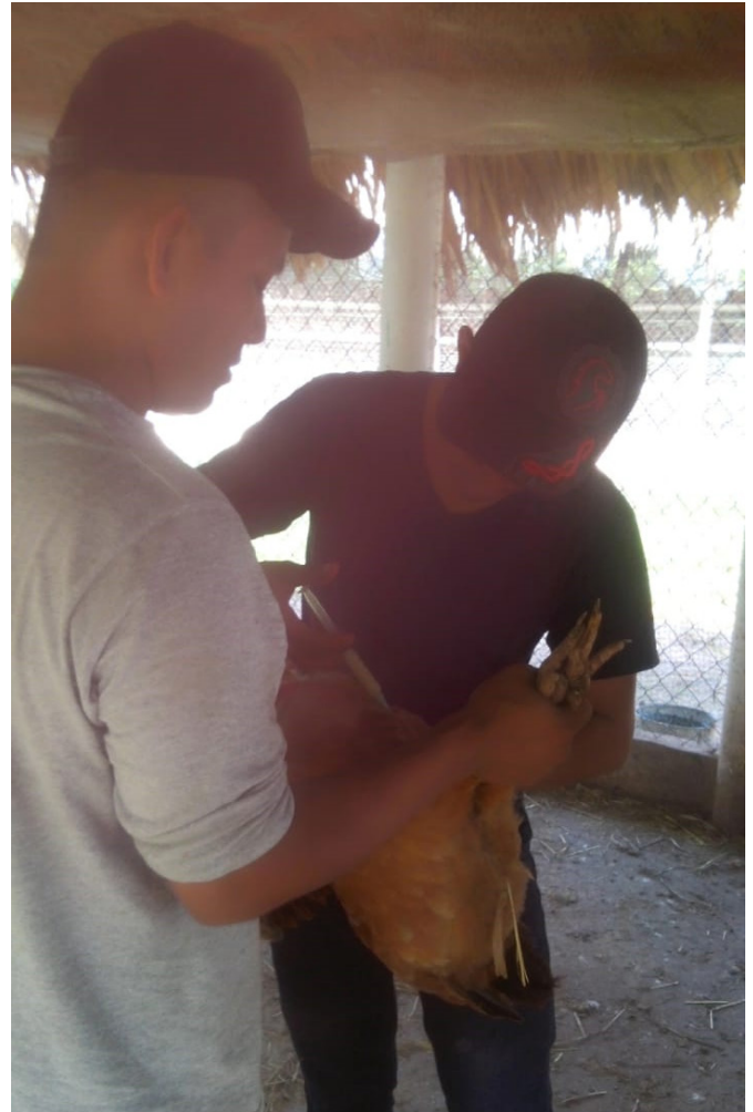
Figura 8. Proceso de vacunación de las gallinas.