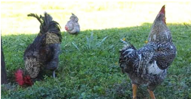
Figura 3. Módulo de gallina libres.