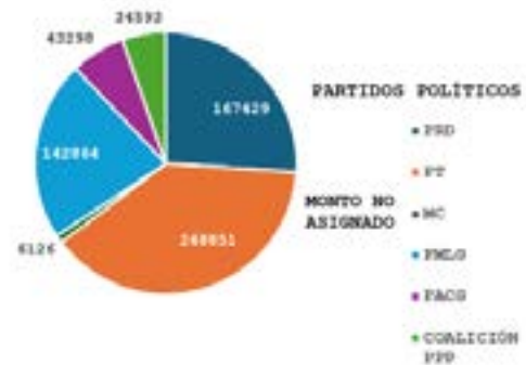
ESTADO DE GUERRERO