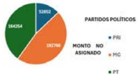
ESTADO DE TABASCO

Con los informes consolidados que realiza el Instituto Nacional Electoral a través de la Comisión de Fiscalización a cada una de las entidades federativas y las concernientes resoluciones emitidas por el Consejo General respecto de la revisión de los informes de ingresos y gastos de campaña de los partidos políticos y coaliciones, queda evidenciado cuales Institutos Políticos tanto nacionales como locales incumplieron los lineamientos aprobados por el Consejo General respecto de lo establecido en el de otorgar al menos el 50% del financiamiento público con el que cuenta cada partido y los montos